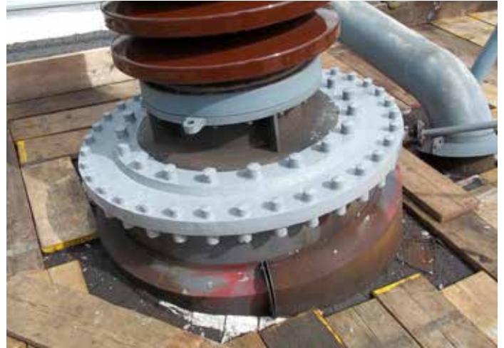
Belzona 5831 usado para sellar una fuga de aceite en un transformador

El recubrimiento Belzona 5831, combinado con el compuesto en pasta Belzona 1161, conforman un completo sistema de reparación.